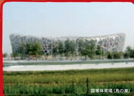
国家体育场（鳥の巣）

この「安全の手引き」は、北京オリンピック観戦のために中国を訪れる皆様の安全を守る一助として作成したものです。最新の安全情報等は、当館にお問い合わせいただくか、当館ホームページにアクセスしてください。