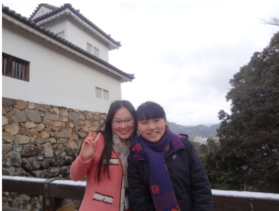
3月8日 彦根城見学 (滋賀県)