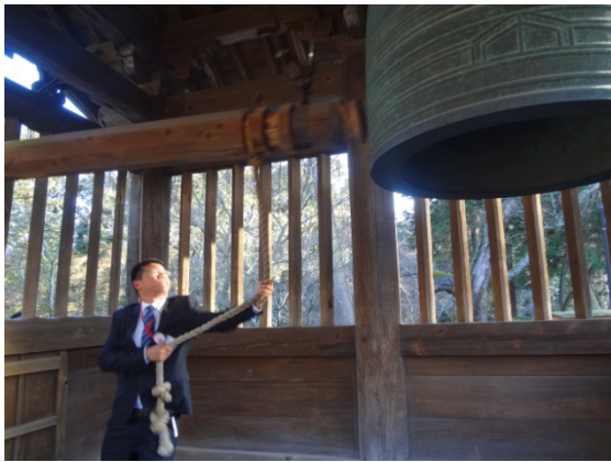
3月7日 園城寺見学 (滋賀県)