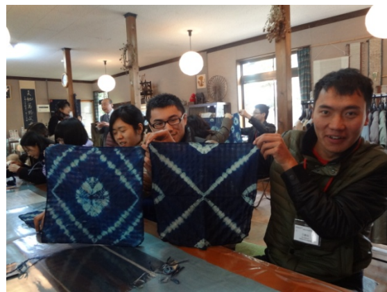
3月8日 藍染め体験 (滋賀県)