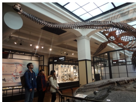
3月11日 国立科学博物館見学 (東京都)