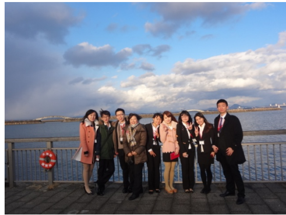
3月8日 琵琶湖見学 (滋賀県)