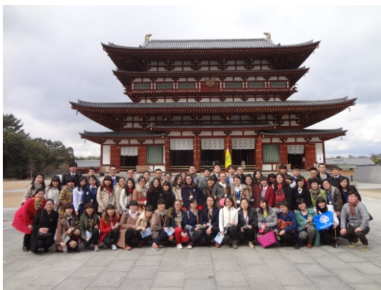
3月8日 奈良県の大学生の案内で薬師寺見学