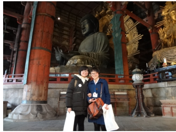
3月7日 東大寺見学 (奈良県)