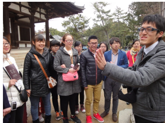
3月8日 奈良県の大学生の案内で唐招提寺見学 (奈良県)