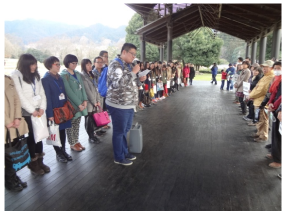
3月9日 明日香村ホームステイ入村式 (奈良)