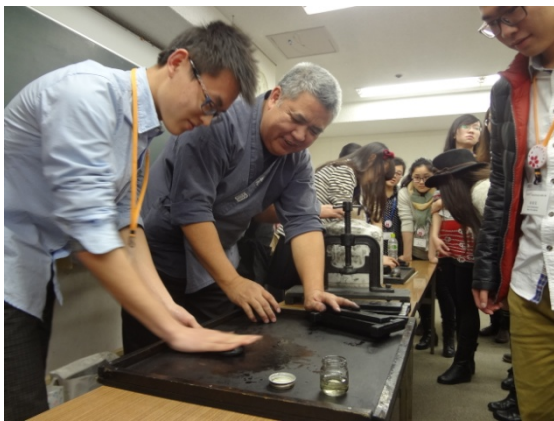
3月8日 にぎり墨体験 (奈良県)