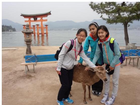
4月16日 世界遺産 宮島・厳島神社視察（広島県）