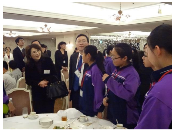
4月14日 歓迎会 汪婉中華人民共和国駐日本国大使館友好交流部参事官が団員と談笑（東京都）