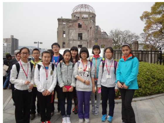
4月16日 世界遺産 平和記念公園・原爆ドーム視察（広島県）