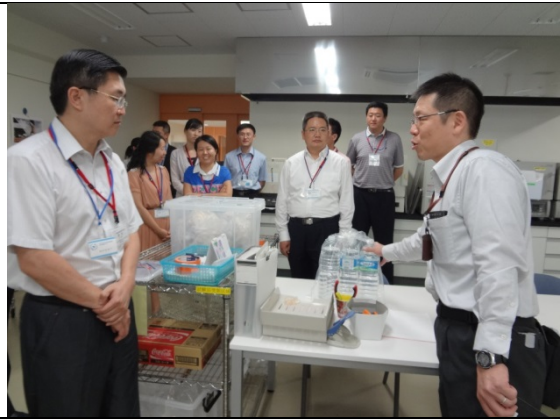
7月30日（一財）日本冷凍食品検査協会 横浜試験センター訪問・視察（神奈川県）