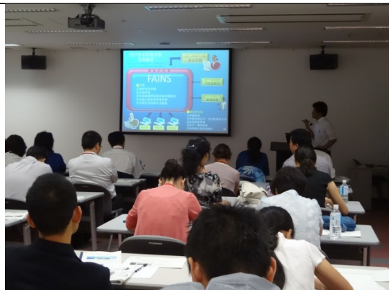
8月1日 厚生労働省神戸検疫所・輸入食品検疫検査センター 訪問・視察（兵庫県）