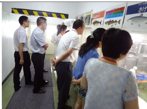
7月29日 日本水産(株) 八王子総合工場 訪問・視察(東京都)