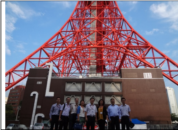
7月29日 東京タワー見学（東京都）