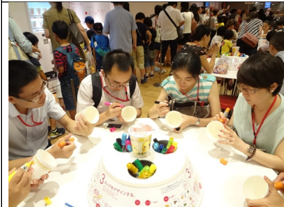
7月30日カップヌードルミュージアム見学 オリジナルのカップヌードル制作を体験 （神奈川県）