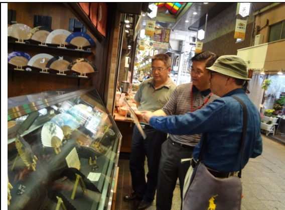
7月31日 地域のボランティアと錦市場の見学（京都府）