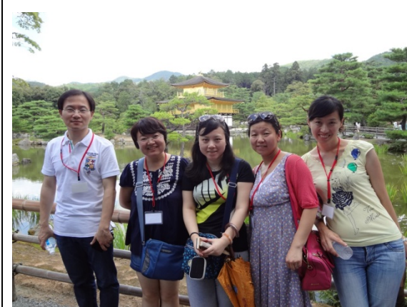
7月31日 金閣寺見学（京都府）