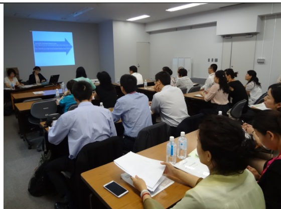
7月28日 厚生労働省ブリーフ 食品安全行政の説明（東京都）