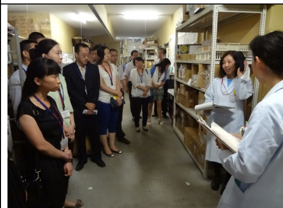
8月2日 イオンモール大阪ドームシティ 訪問・視察（大阪府）