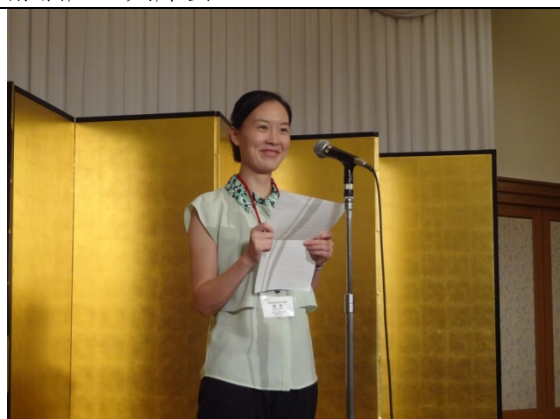
8月2日 歓送報告会 訪日成果報告（大阪府）