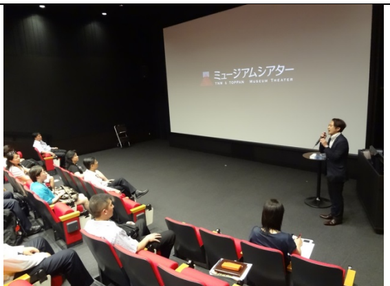
7月28日 TNM&TOPPAN ミュージアムシアター 一見学（東京都）