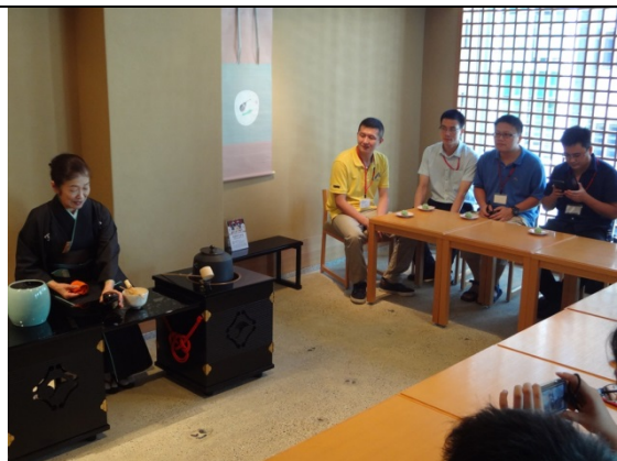
7月31日 福寿園京都本店にて茶道体験 （京都府）