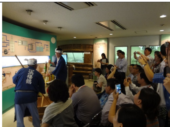
8月1日 小山本家酒造灘浜福鶴蔵見学（兵庫県）