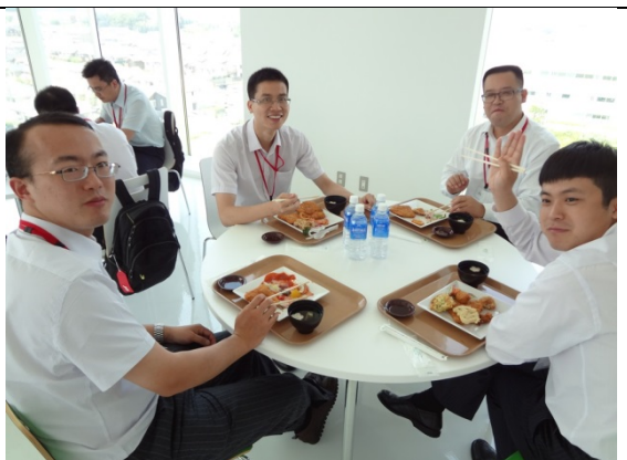
7月29日 日本水産(株)東京イノベーシ ョンセンター訪問 商品を使用した昼食 を頂く(東京都)