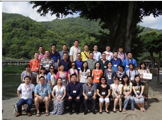
7月31日 嵐山渡月橋見学（京都府）