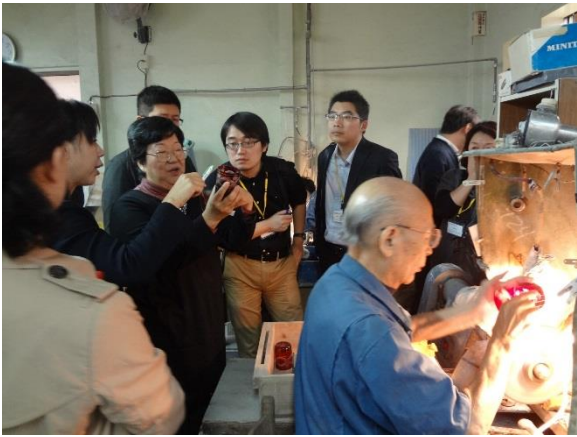
10月27日 (株)清水硝子訪問・視察(東京都)