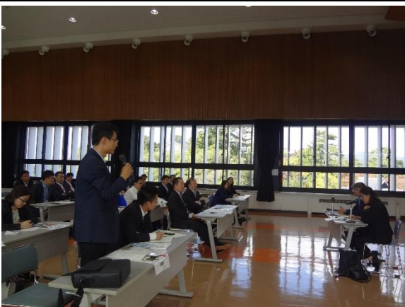
10月28日 島根県庁による講義(島根県)