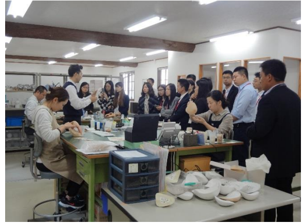
10月29日 中村ブレイス(株)訪問・視察(島根県)