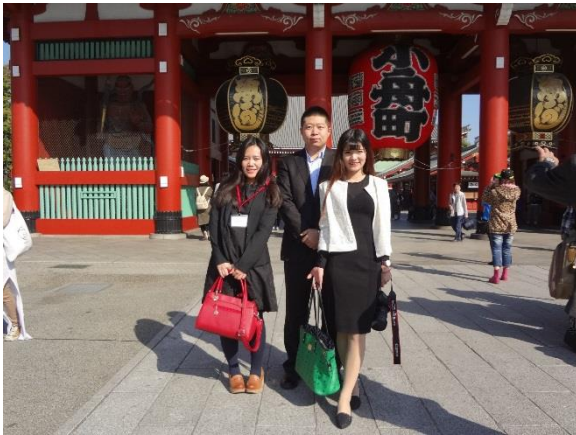
10月27日 浅草寺見学(東京都)