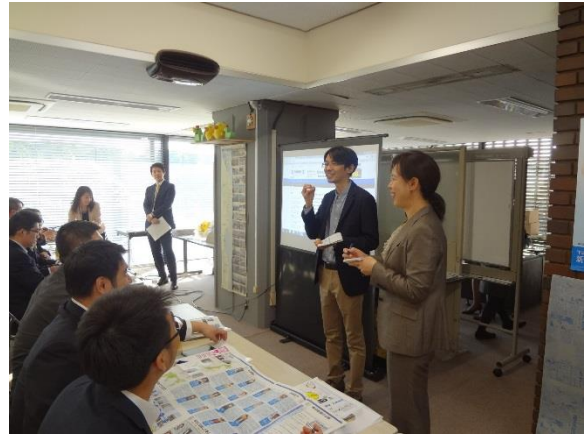
10月26日 (株)毎日新聞社訪問・交流(東京都)