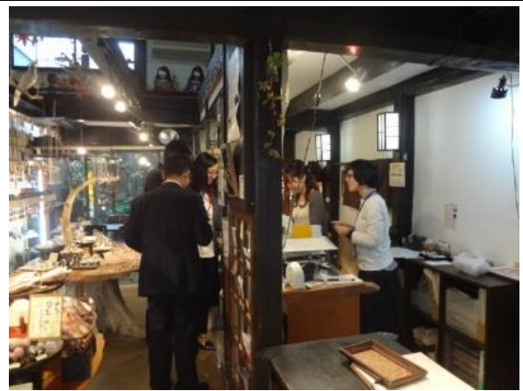
10月30日 松江京店商店街で自由取材(島根県)