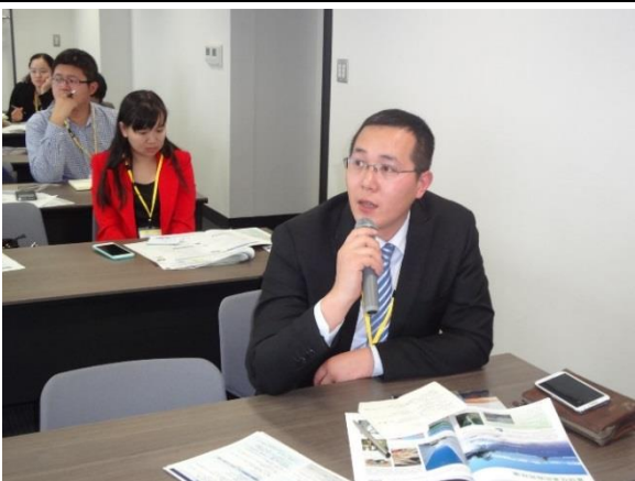
10月28日 富山県庁による講義(富山県)