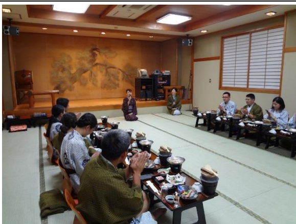
10月28日 旅館の女将が和食のおもてなしについてレクチャー(静岡県)