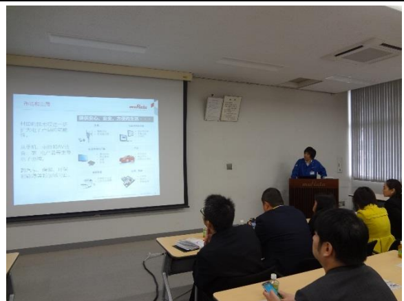
10月29日 (株)富山村田製作所訪問・視察(富山県)