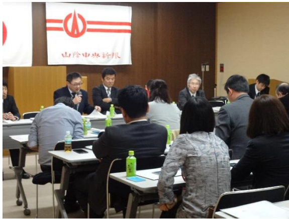
10月30日 (株)山陰中央新報社訪問・交流 (島根県)