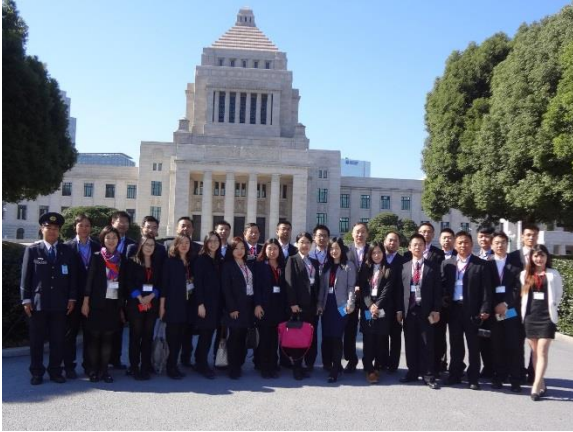
10月26日 国会議事堂視察(東京都)