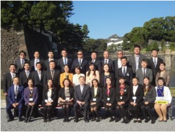
10月26日 皇居二重橋見学(東京都)