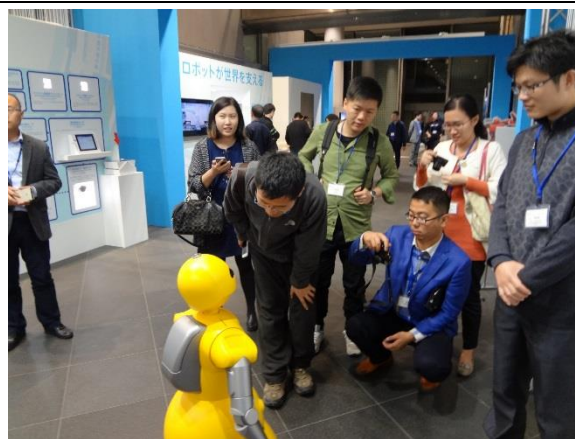
10月27日 TEPIA 先端技術館見学(東京都)