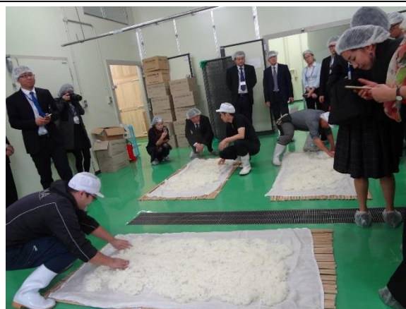
10月29日 静岡平喜酒造(株)訪問・視察(静岡県)