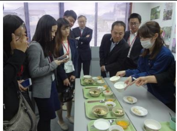
10月28日 (福)みずうみ 特別養護老人ホームすまいる苑訪問・視察(島根県)