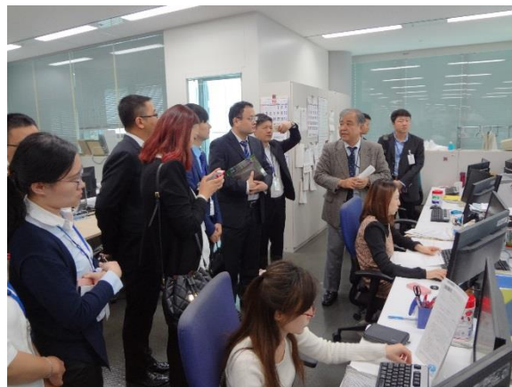
10月26日 (一社)共同通信社訪問・交流(東京都)