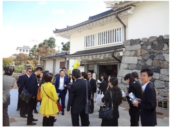
10月28日 富山城見学(富山県)