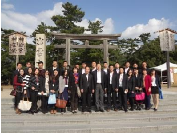
10月29日 出雲大社見学(島根県)