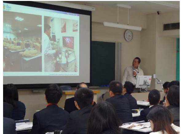
10月27日 聖路加国際病院訪問・視察(東京都)