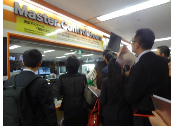
10月26日 (株)フジテレビジョン訪問・交流(東京都)