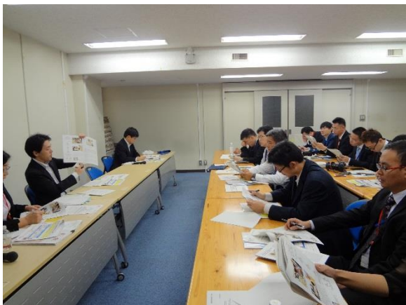
10月26日 農林水産省による講義(東京都)