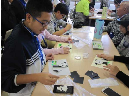
11月26日 障害者支援施設 社会福祉法人 仁栄会『春叢園』視察（徳島県）