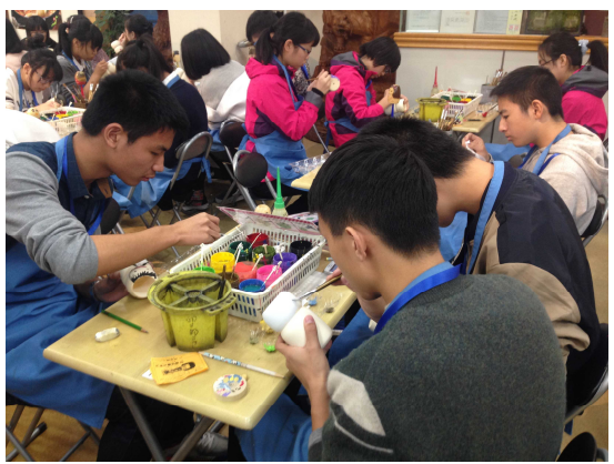
11月29日 卯三郎こけし こけし絵付け体験（群馬県）