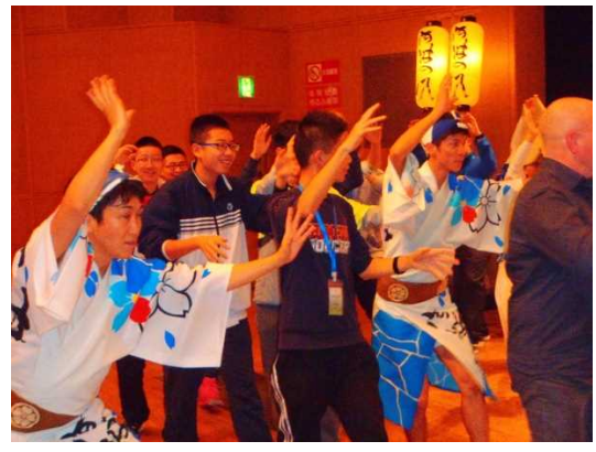
11月26日 阿波おどり会館視察（徳島県）