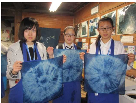
11月27日 藍の館・藍染め体験（徳島県）