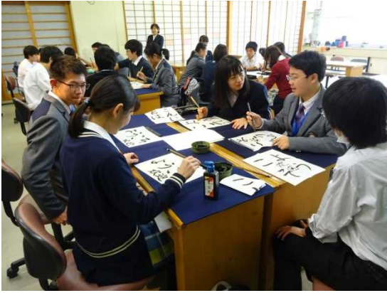
11月30日 横浜市立南高等学校訪問・交流（神奈川県）