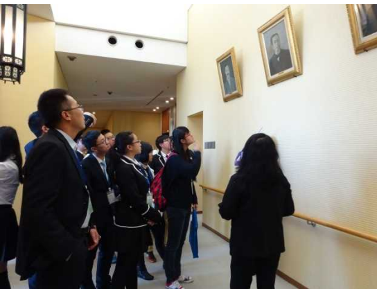
12月1日 明治大学訪問（東京都）