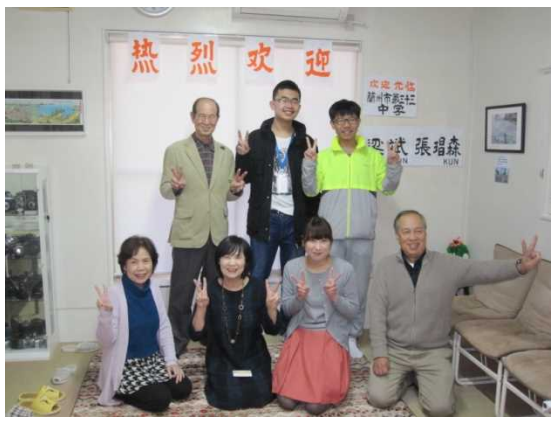
11月28日 ホームステイ（徳島県）