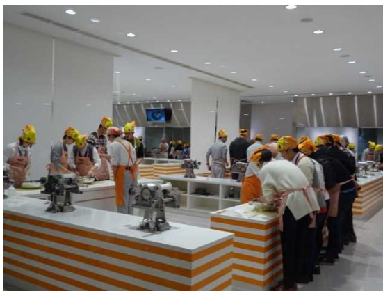
11月29日 カップヌードルミュージアム参観（神奈川県）