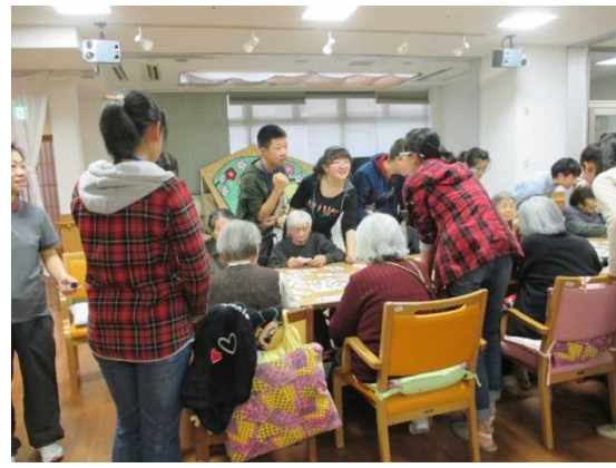
11月28日 橿原の郷視察（奈良県）