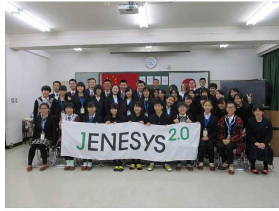
11月27日 兵庫県立北摂三田高等学校訪問・交流（兵庫県）