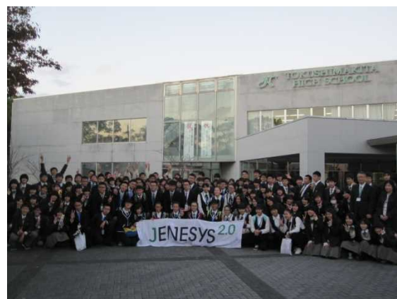
11月27日 徳島県立徳島北高等学校訪問・交流（徳島県）