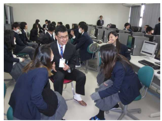
11月30日 兵庫県立伊川谷高等学校訪問・交流（兵庫県）