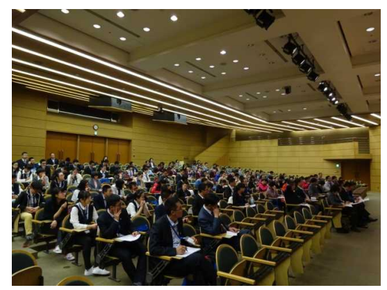
12月1日 歓送報告会（東京都）