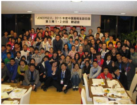
11月28日 ホームビジット（兵庫県）