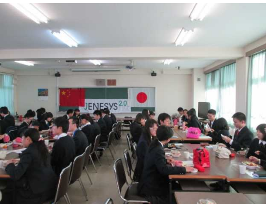
11月30日 奈良県立平城高等学校訪問・交流（奈良県）