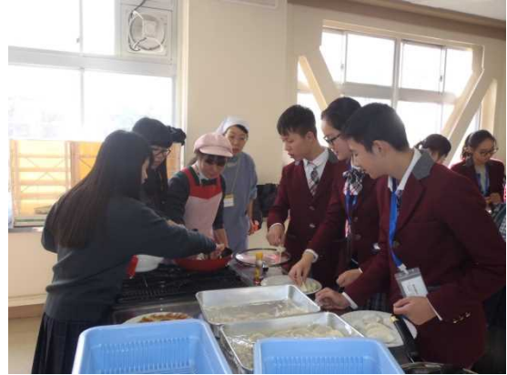
11月30日 群馬県立利根実業高等学校訪問・交流（群馬県）