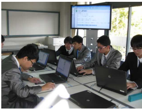
11月27日 須磨学園高等学校訪問・交流（兵庫県）