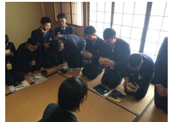
12月14日 福岡市立福岡西陵高等学校 訪問・交流（福岡県）