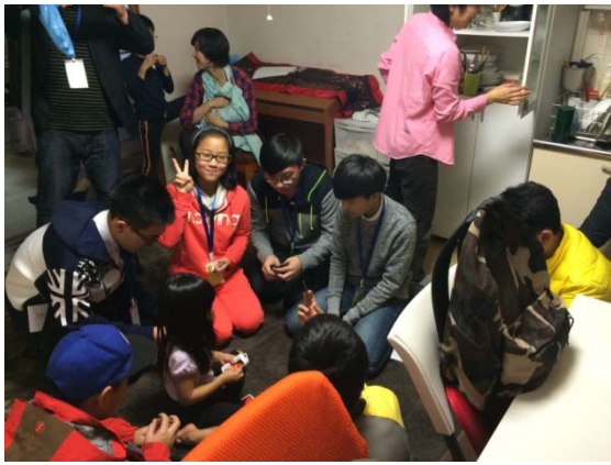
12月13日 ホームビジット（福岡県）