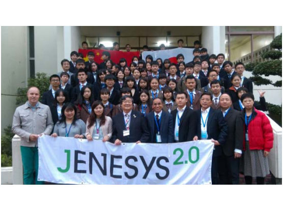
12月14日 至学館高等学校訪問・交流 （愛知県）