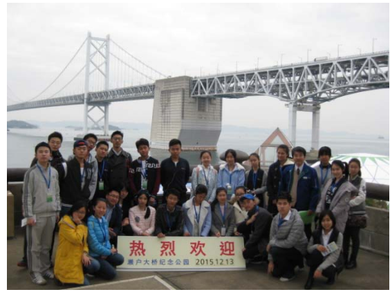
12月13日 瀬戸大橋記念館参観（香川県）