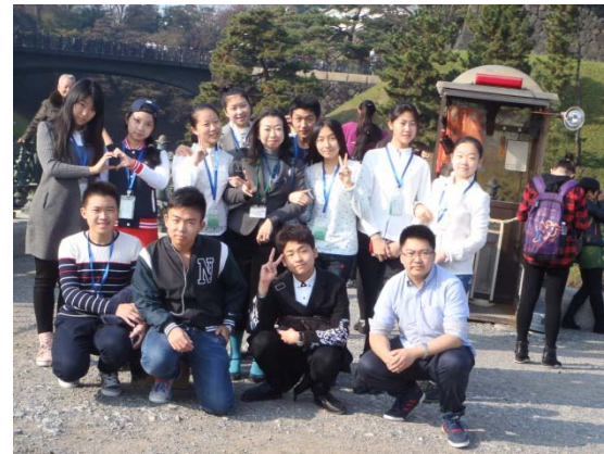
12月16日 皇居・二重橋參觀 （東京都）