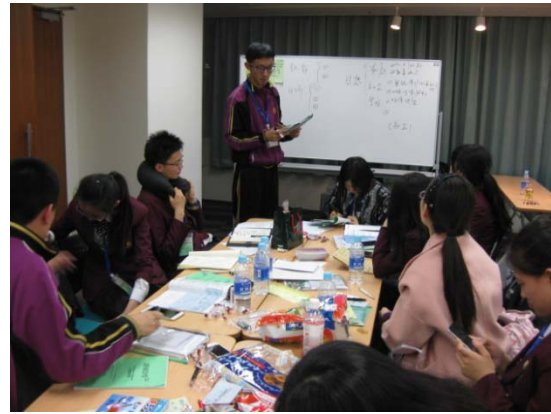
12月14日 ワークショップ（岡山県）