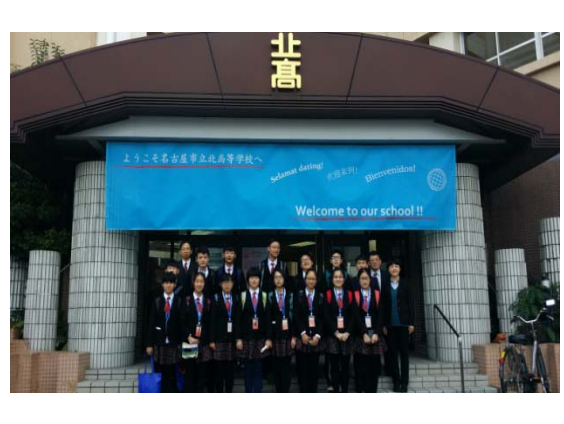
12月14日 名古屋市立北高等学校 訪問・交流（愛知県）