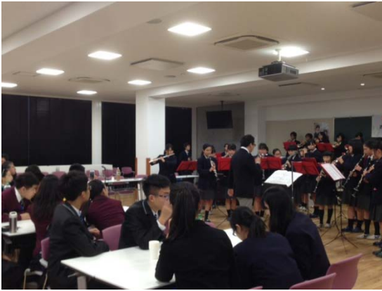
12月14日 金光学園中学・高等学校 訪問・交流（岡山県）