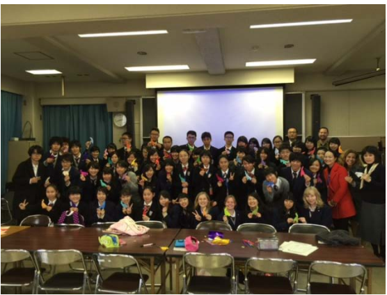
12月14日 名古屋市立名東高等学校 訪問・交流（愛知県）