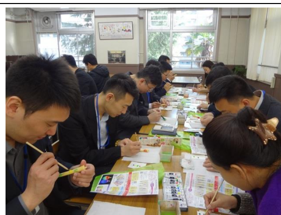
3月17日 体验在日式蜡烛上绘画(兵库县)