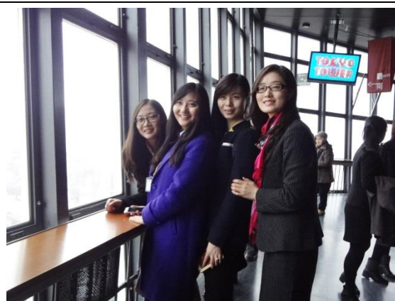
3月14日 参观东京塔 (东京都)