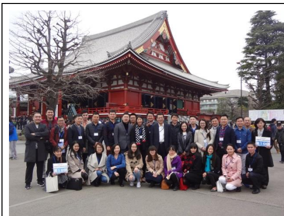
3月13日 参观浅草寺 (东京都)