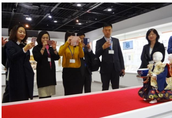
3月15日 听取株式会社东芝的讲座并进行 考察 (神奈川县)