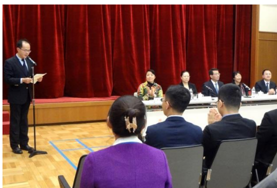
3月14日 访问中华人民共和国驻日本国大使馆 (东京都)