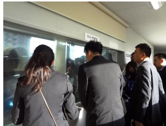
3月16日 参观滩之酒窖 (兵库县)