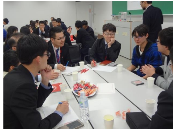
3月15日 访问日本大学法学部并进行交流 (东京都)