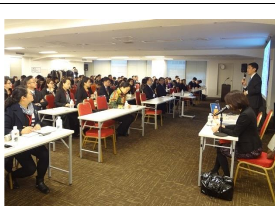
3月14日 听取厚生劳动省的讲座(东京都)