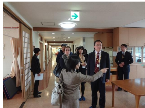
3月16日 在幸福之村考察神港园幸福之家 (养老院) (兵库县)