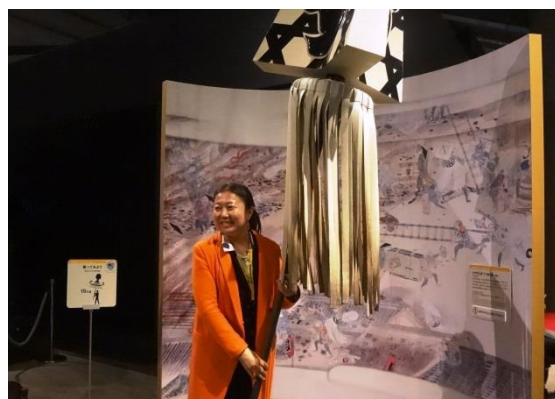
3月15日 参观江戸东京博物馆 (东京都)