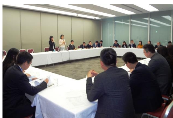
3月15日 访问一般社团法人日本经济团体 联合会并听取讲座 (东京都)