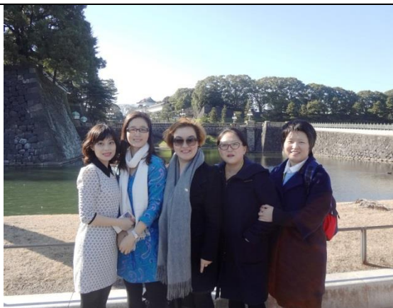
3月15日 参观皇居二重桥 (东京都)