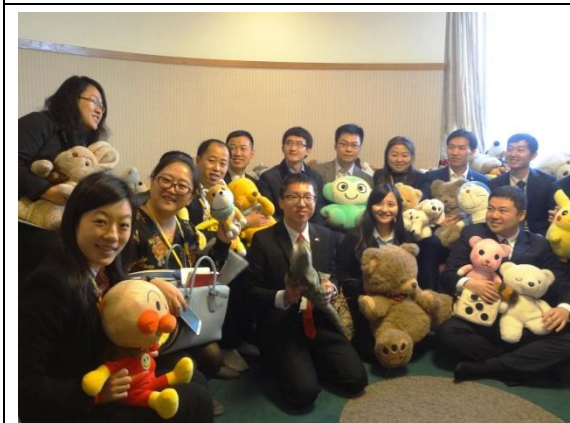
3月17日 访问足长（长腿叔叔）育英会神戸彩虹屋并考察设施（兵库县）