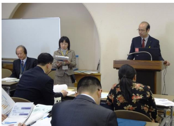
3月16日 听取神戸市政府的讲座 (兵库县)