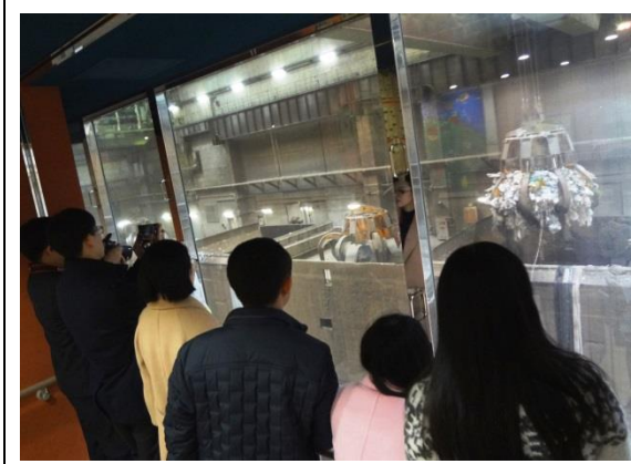
3月17日 考察大阪市环境局舞洲工厂（大阪府）