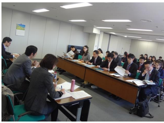
3月15日 访问内阁府并听取讲座(东京都)