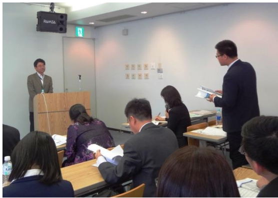
3月16日 听取积水住宅株式会社の讲座 (兵库县)