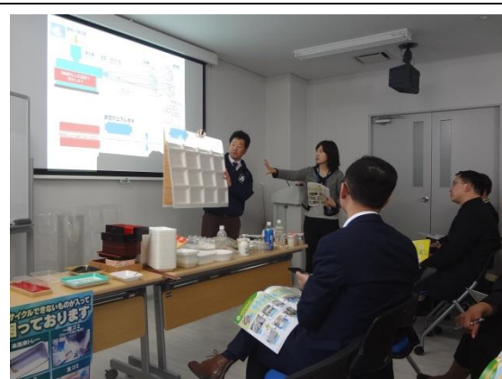
3月17日 考察FPCO AI PACK株式会社西宫工厂（兵库县）