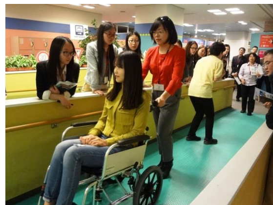
3月17日 考察ATC忘年中心（大阪府）