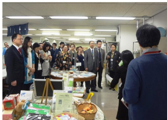
3月15日 访问东京志愿者和市民活动中心 并考察设施 (东京都)