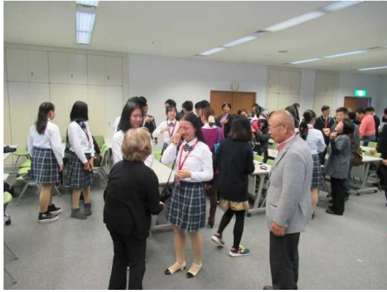
12月11日 家庭寄宿体验活动结束后的欢送会上（北海道）