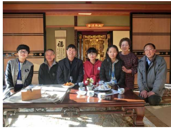
12月10日 民宿农业体验活动(滋贺县)