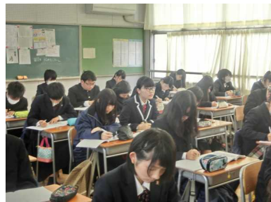
12月12日 访问爱知县立木曾川高中并进行交流（爱知县）