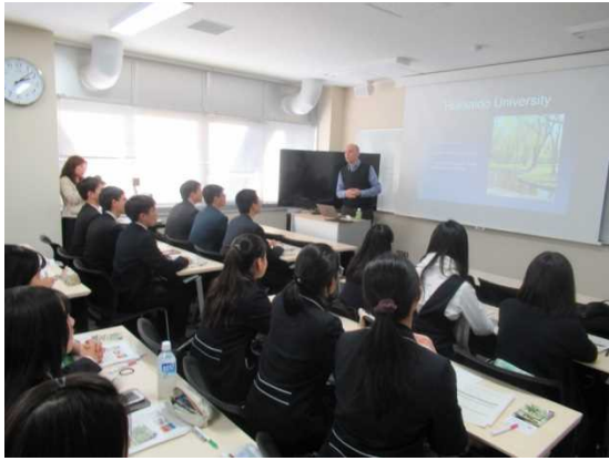
12月8日 访问北海道大学（北海道）