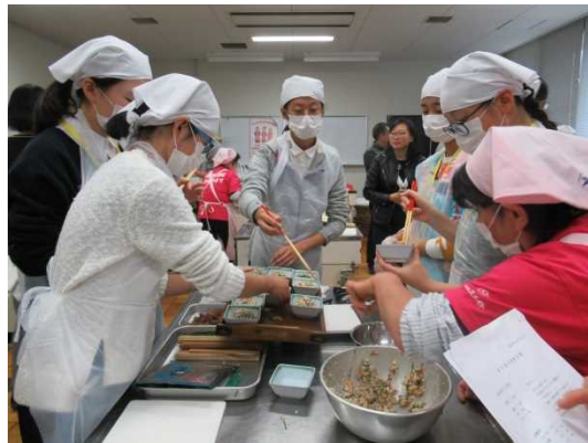
12月11日 民宿农业体验活动（三重县）