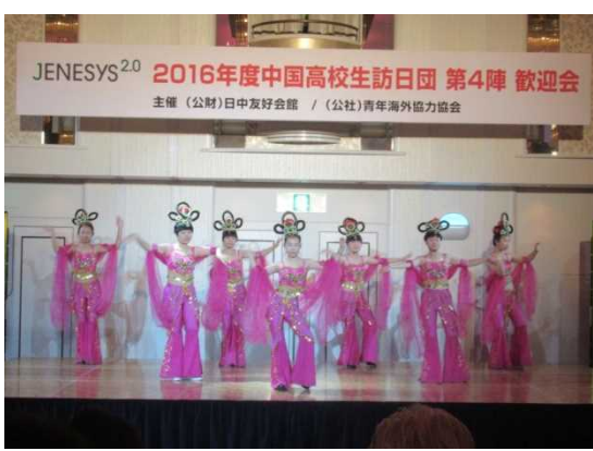
12月7日 欢迎会上中国高中生表演节目 （东京都）