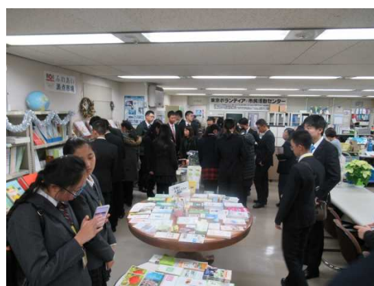
12月7日 考察东京志愿者市民活动中心 （东京都）