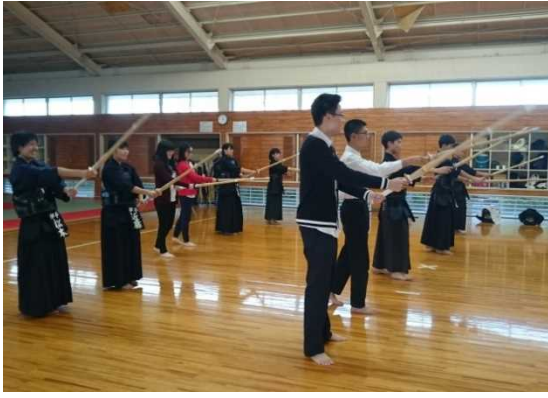
12月9日 访问爱媛县立伊予高中并进行交流 (爱媛县)