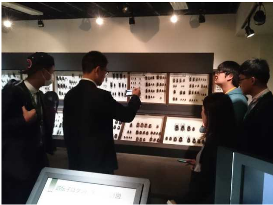
12月8日 访问爱媛大学（爱媛县）