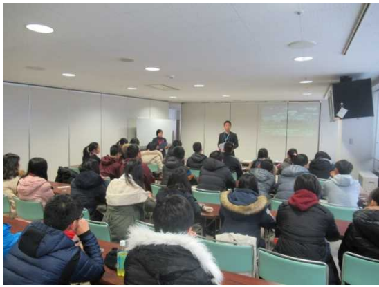
12月10日 考察札幌冬季体育博物馆并听取国际贡献和志愿者活动讲座(大仓山跳台竞技场) (北海道)