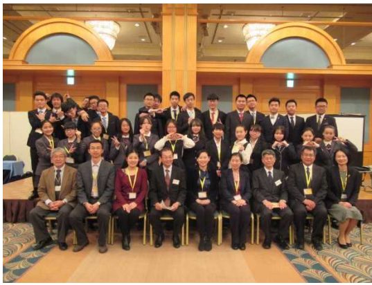
12月13日 欢送报告会 (东京都)