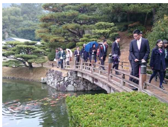
12月13日 参观日本特别名胜栗林公园 (香川县)