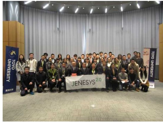
12月8日 访问东洋大学（东京都）