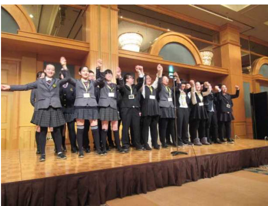
12月13日 欢送报告会上中国高中生表演节目 (东京都)