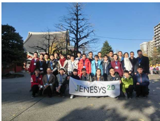
12月6日 参观浅草・上野（东京都）