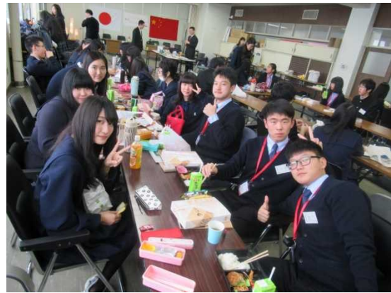
12月9日 访问北海道札幌丘珠高中并进行交流（北海道）