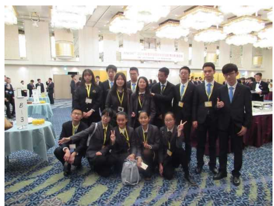
12月7日 欢迎会上中国高中生合影(东京都)