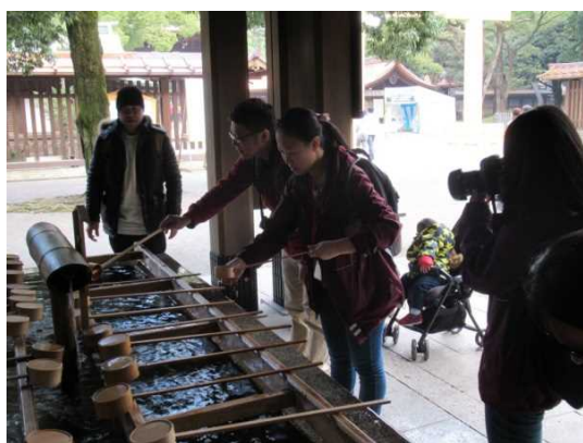
12月13日 参观明治神宫 (东京都)