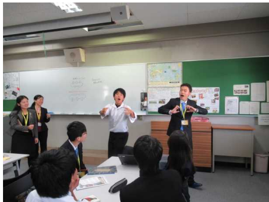
12月12日 访问名古屋市立北高中并进行交流 (爱知县)