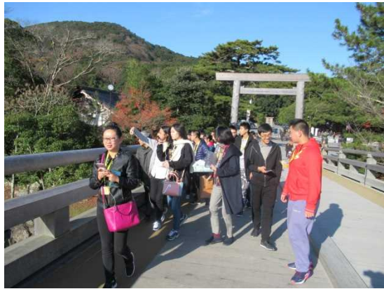
12月10日 参观伊势神宫内宫(三重县)