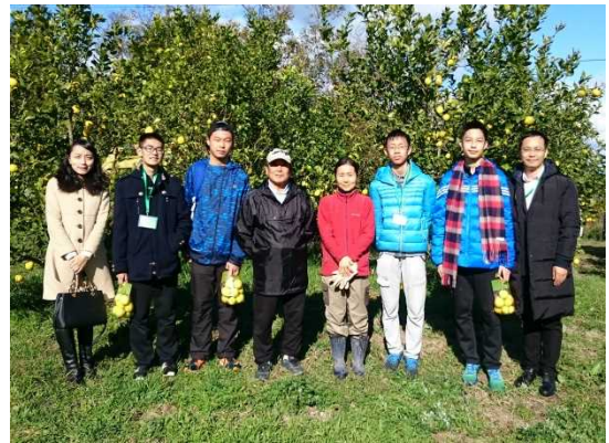
12月11日 民宿农业体验活动（香川县）