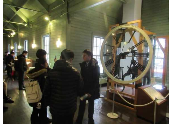
12月9日 参观札幌市钟楼(北海道)