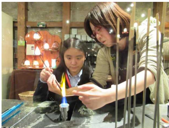
12月12日 体验制作蜻蜓玉（北海道）