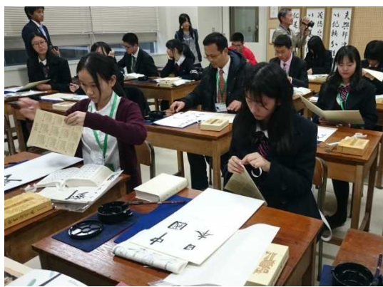
12月12日 访问学校法人高松中央高中并进行交流 (香川县)