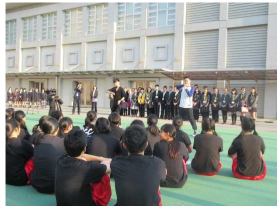
12月9日 访问学校法人梅村学园三重高中并进行交流（三重县）