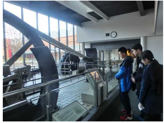
12月11日 考察丰田产业技术纪念馆(爱知县)