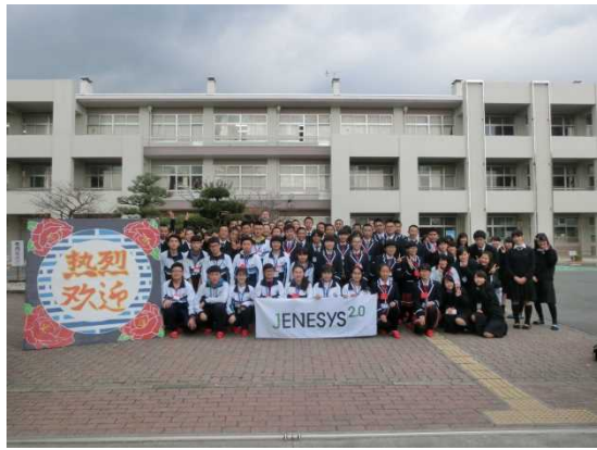
12月9日 访问滋贺县立高岛高中并进行交流（滋贺县）