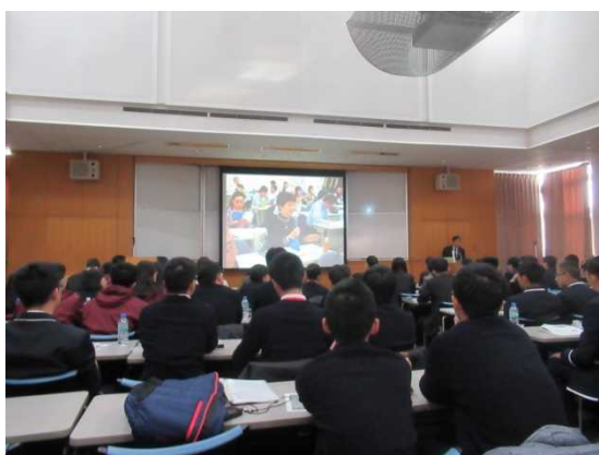
12月7日 听取东京都外国人款待语学志愿者 育成讲座(东京都)