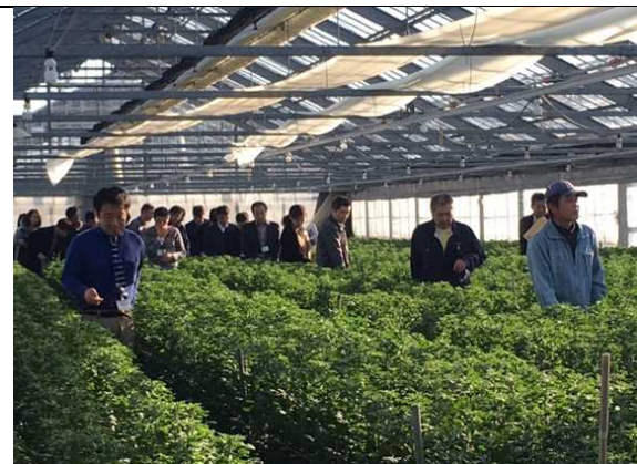
12月19日 考察花卉(菊花)农户 (爱知県)