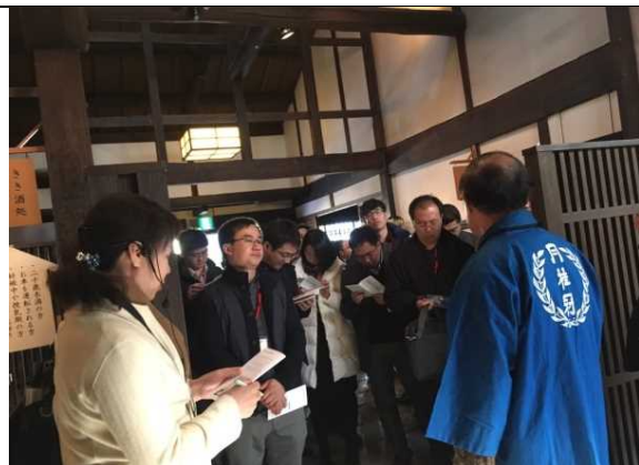
12月18日 考察月桂冠大仓纪念馆 (京都府)