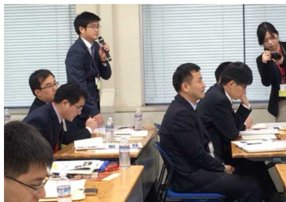
12月15日 访问农林水产省 (千叶县)