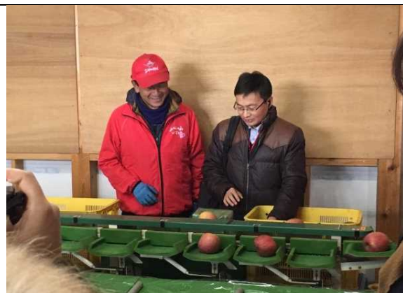
12月16日 访问苹果农户 (群馬县)