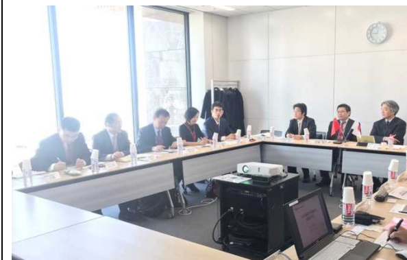
2月17日 访问丸红株式会社