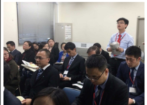
2月20日 访问农研机构九州冲绳农业研究中心 （熊本县）