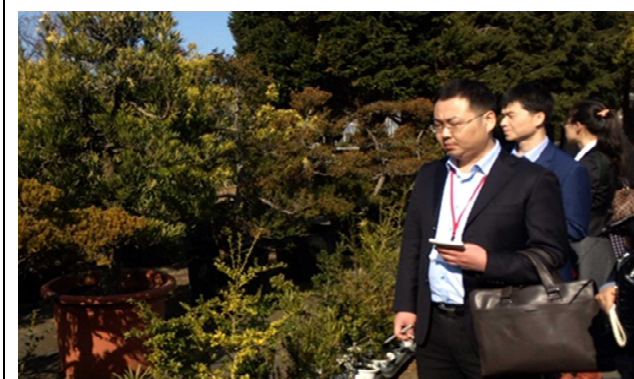
2月17日 访问千叶县农林综合研究中心