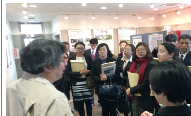
2月16日 访问农林水产省横浜植物防疫所