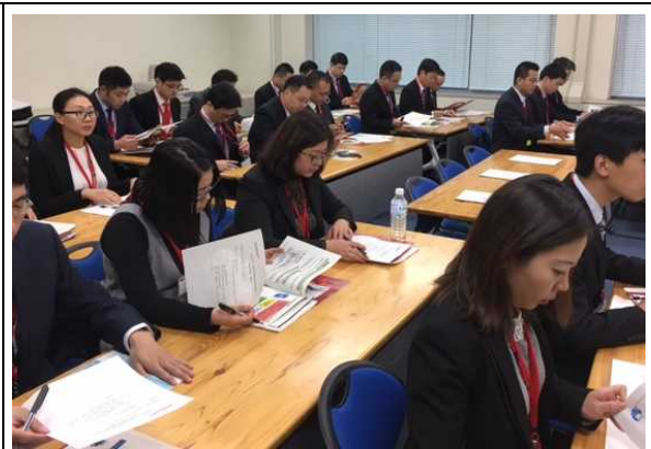
2月16日 访问农林水产省