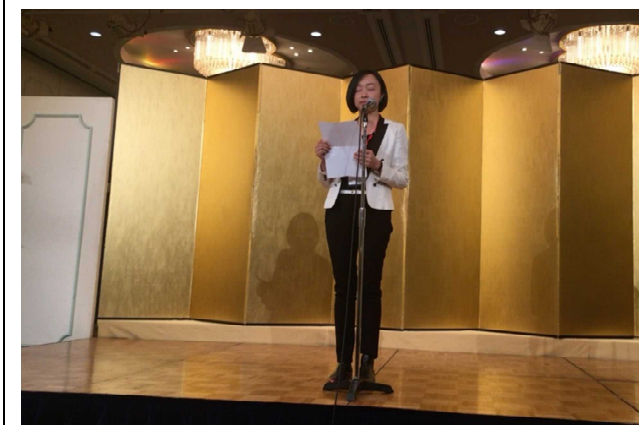
2月21日 欢送报告会 （福冈县）