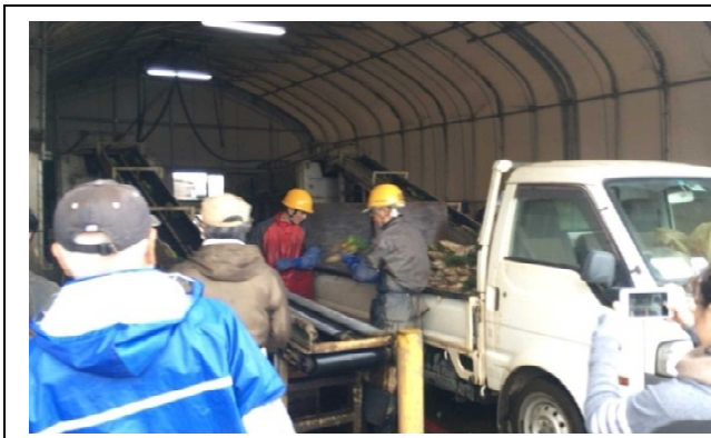
2月17日 访问 JA 市原市姉崎蔬菜工会（萝卜洗净分拣设施） （千叶县）