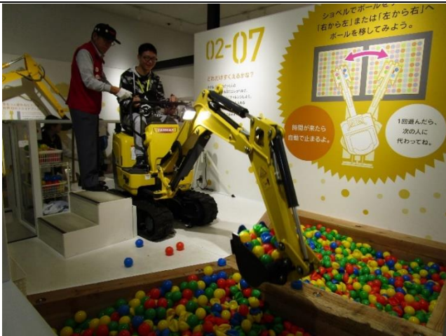
10月19日 考察洋馬博物館（滋賀県）