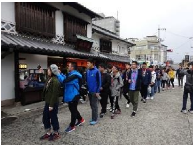
10月19日 参观仓敷美观地区(冈山县)