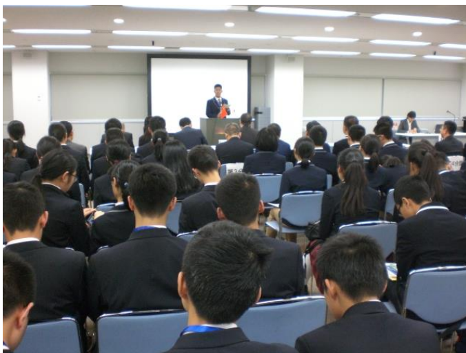
10月24日 欢送报告会 团员汇报访日成果（东京都）