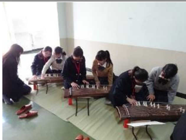
10月23日 访问大阪府立桜冢高中并进行交流 (大阪府)