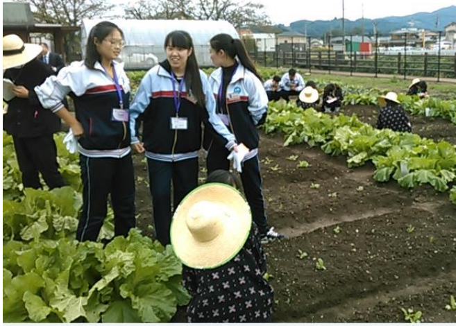
10月20日 访问福冈县立八女农业高中并进行交流 (福冈县)