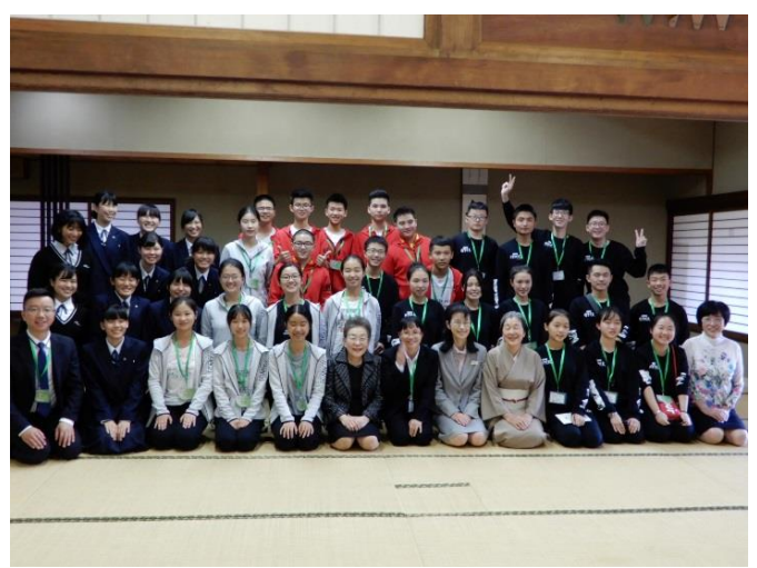
10月20日 访问福冈县立明善高中并进行交流（福冈县）