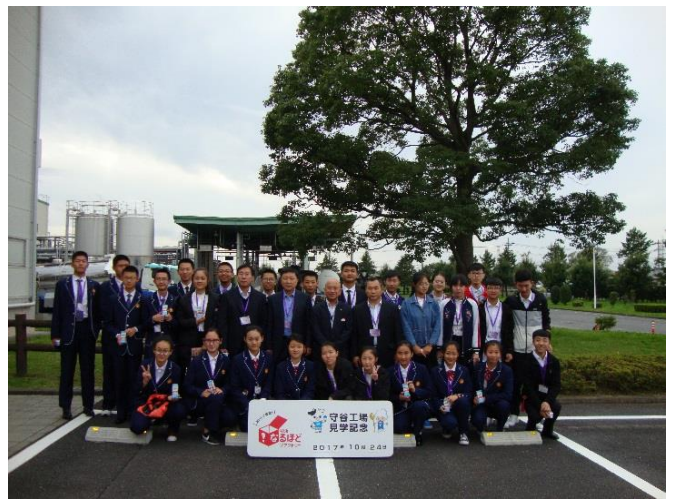
10月24日 考察明治工厂守谷(茨城县)