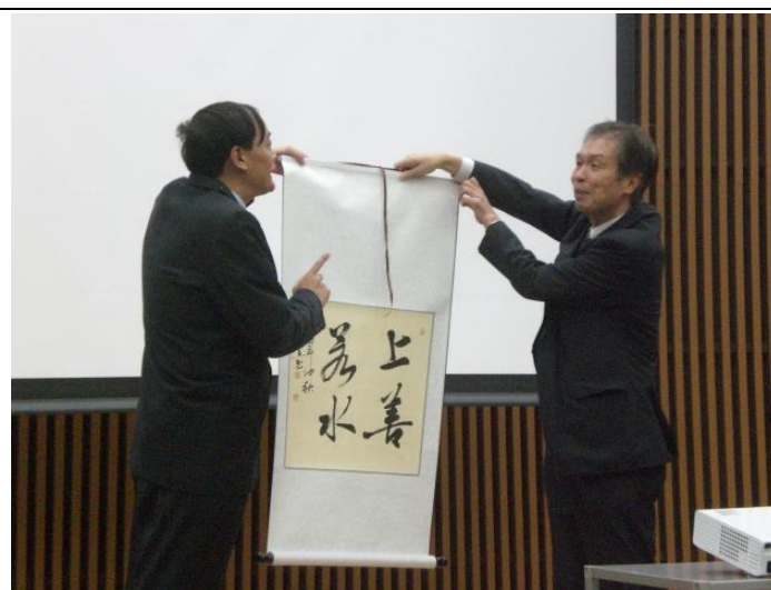
10月18日 关于企业和创新的讲座（东京都）