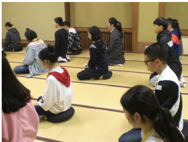
10月22日 体验坐禅（大门山永平寺）（福井县）