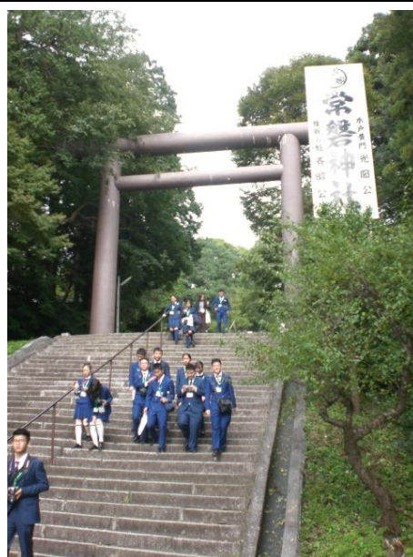
10月24日 参观偕乐园和常磐神社(茨城县)