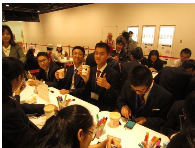
10月23日 考察杯面博物馆大阪池田(大阪府)