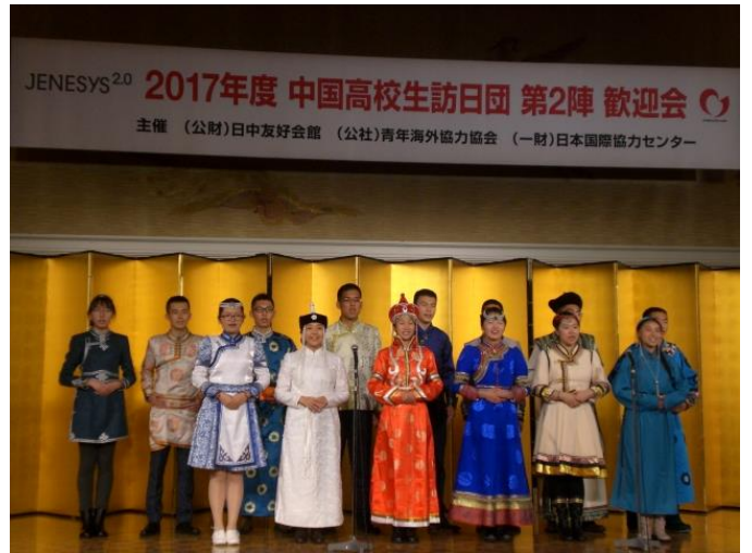
10月18日 歓迎会 中国高中生表演（东京都）