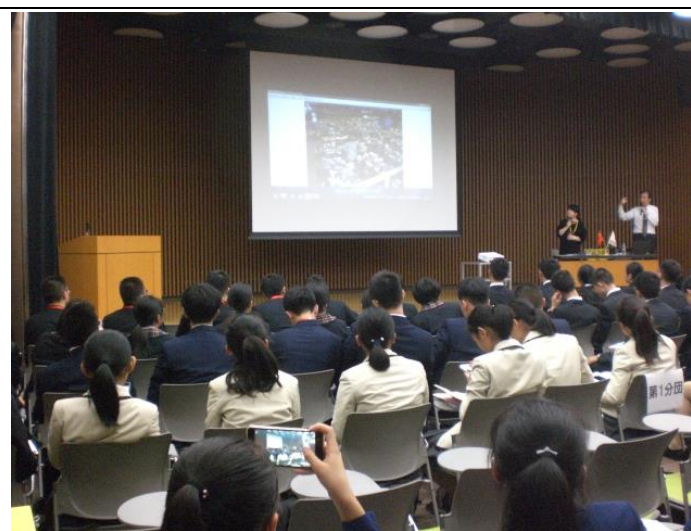
10月18日 关于企业和创新的讲座（东京都）