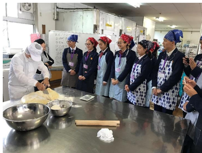
10月20日 访问福冈县立有明新世高中并进行交流(福冈县)