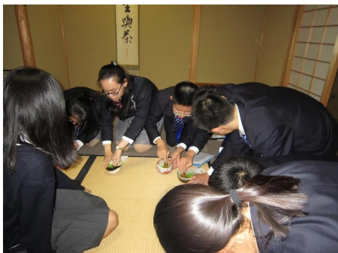
10月20日 访问金光学园初中·高中并进行交流 (冈山县)