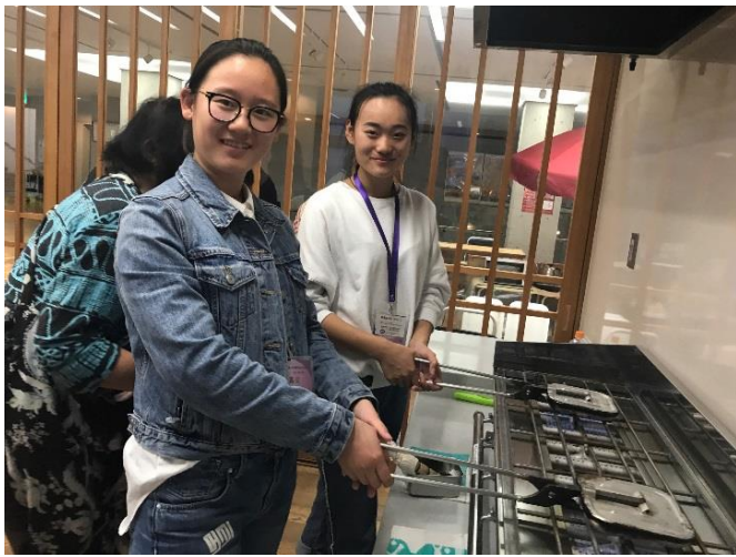
10月21日 体验烤梅枝饼(福冈县)