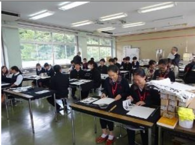
10月20日 访问冈山县立瀬户高中并进行交流 (冈山县)