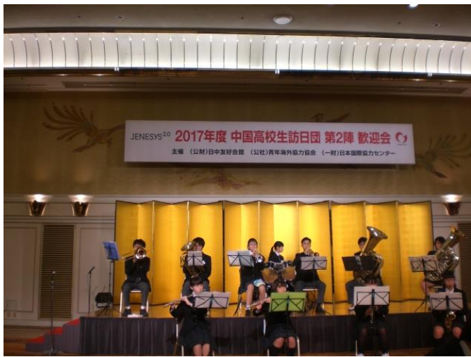
10月18日 歓迎会 与東京都立田柄高中吹奏乐队学生交流（东京都）