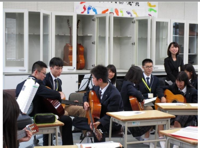
10月20日 访问滋賀県立国際信息高中并进行交流（滋賀県）