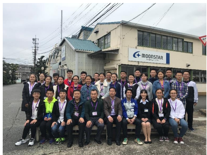
10月19日 考察月星运动鞋工厂(福冈县)