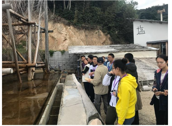
10月21日 参观二见浦、一番盐工作室 (福冈县)