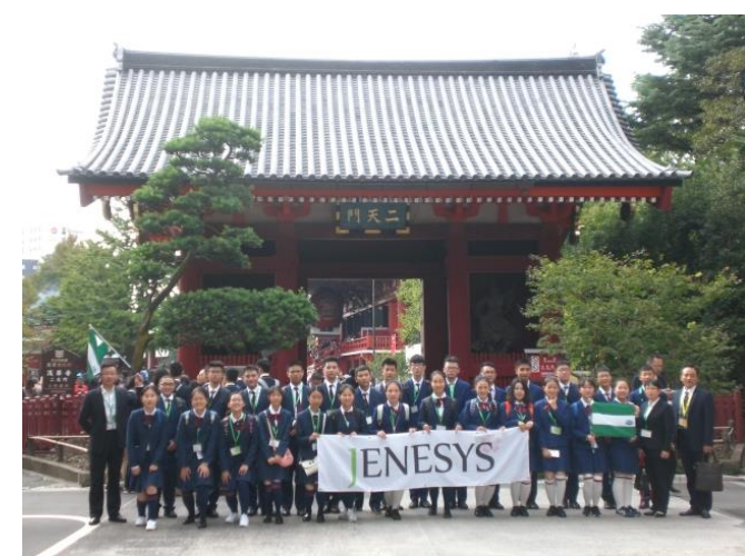
10月18日 参观浅草寺・仲见世大道（东京都）