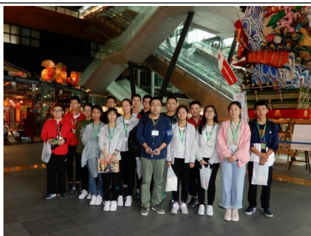
10月21日 参观九州国立博物馆(福冈县)