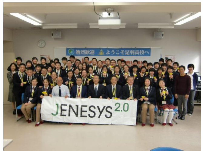
10月23日 访问福井县立足羽高中并进行交流（福井县）