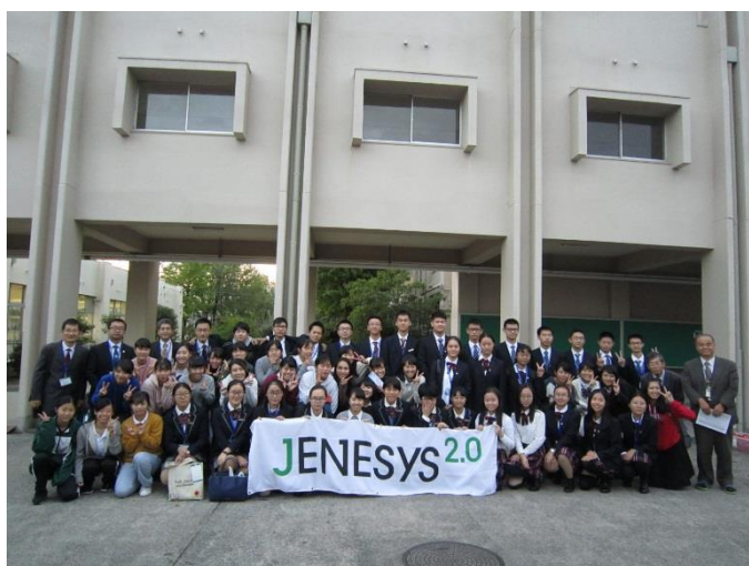
10月23日 访问大阪府立三岛高中并进行交流 (大阪府)