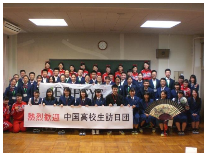
10月23日 访问茨城县立水戸商业高中并进行交流(茨城县)