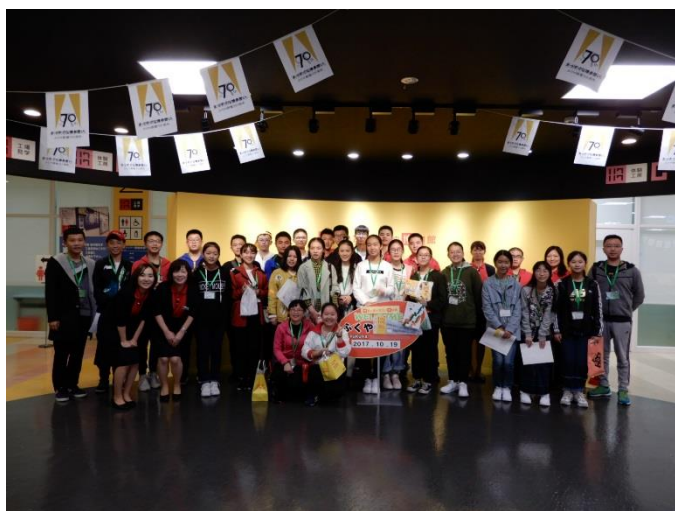
10月19日 考察福屋工厂“Hakuhaku”（福冈县）