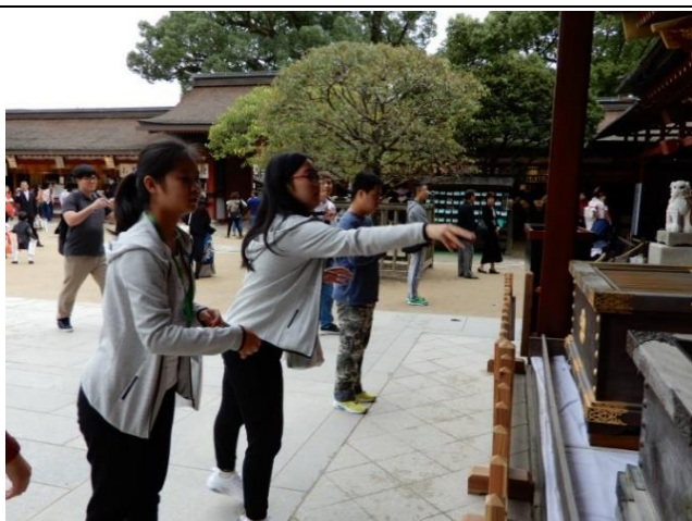
10月21日 参观太宰府天满宫(福冈县)