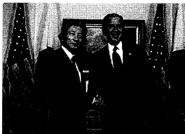
日美首脑会谈上的日美双方首脑

在当今的国际社会，若要仅仅依靠本国的意志和力量确保国家的和平和独立，必须构筑一个无懈可击的防卫系统，以对应各种各样的状况——从包括使用核武器的战争到形式多样的侵略事态，乃至使用武装力量进行示威和恫吓等状况——的发生。然而，对于我国来说，单单凭借本国力量维持这种体系，不仅在经济方面行之不易，作为政治姿态更是不适当的。而日美双方在基本价值观方面都尊重自由和人权、推崇民主主义建设，共同关注远东和平及安全的维持，在经济方面也保持着密切的关系。为此，日本与拥有强大军事力量的美国维持同盟关系，意在利用其威慑力量有效地双边的为本国的安全保障服务，在适当保持本国防卫能力的同时构筑一个无懈可击的体系，以确保我国的安全。两国之间这种安全保障关系以日美安保条约为基础，不仅能够确保日本的安全，更奠定了维持本地区稳定和繁荣的基础。这在 96 年 4 月日美首脑会谈时发布的《日美安保宣言》中得到了再度确认。之后，两国又在包括 2005 年 11 月日美首脑会谈在内的多次场合对此重新进行了确认。