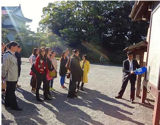
10月18日 二条城見学 (京都市)