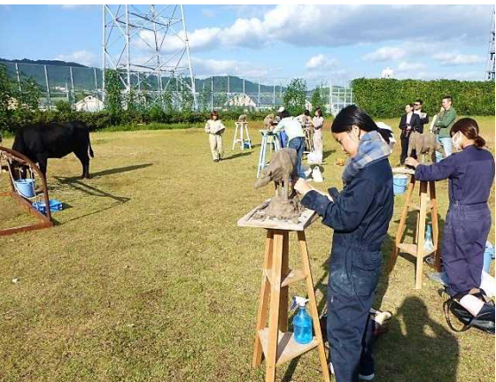
10月17日 京都市立芸術大学訪問 牛をモデルにした実技の見学(京都市)