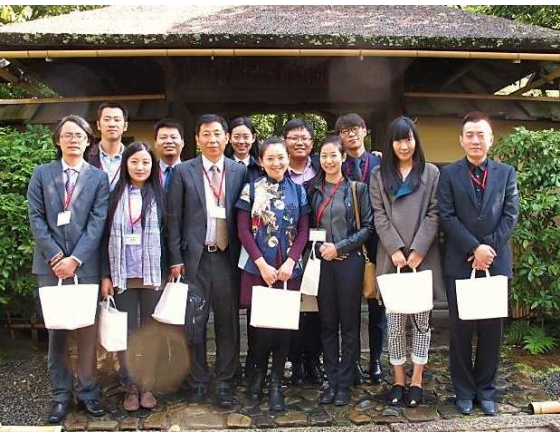
10月17日 裏千家 茶道文化の紹介 (京都市)