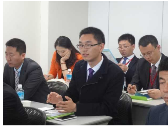
3月26日 ハローワーク梅田訪問・視察（大阪府）