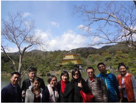
3月25日 金閣寺見学（京都府）