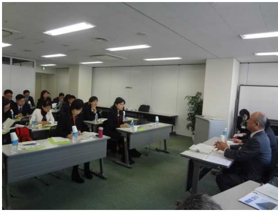
3月26日 ハローワーク梅田訪問・視察（大阪府）