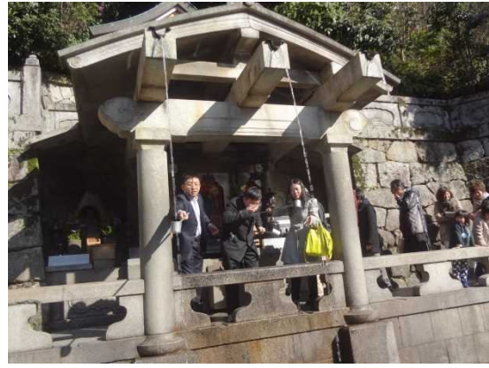
3月25日 清水寺見学（京都府）