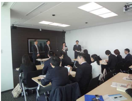
3月26日 パナソニックセンター大阪訪問・視察（大阪府）