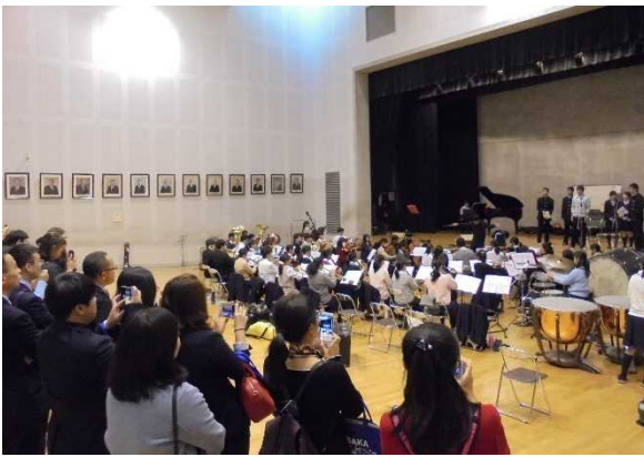
11月15日【访问交流】大阪府立北野高中 (第1分团)