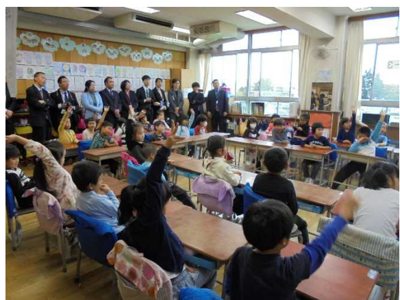
11月13日【访问交流】新宿区立落合第一小学(第1分团)