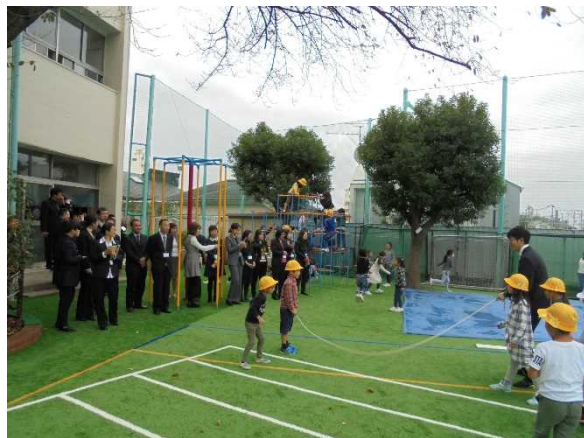
11月13日【访问交流】新宿区立落合第一小学(第1分团)