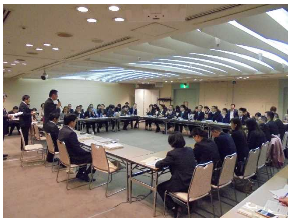
11月15日【交流】与大阪府教育厅的恳谈会