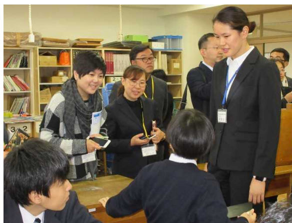
11月13日【访问交流】丰岛区立西池袋中学(第2分团)