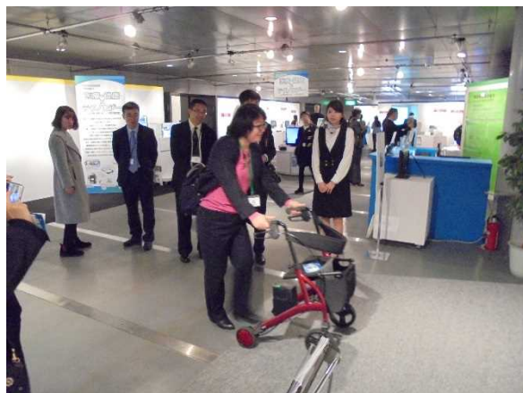
11月13日【参观】TEPIA 先端技术馆(第1分团)