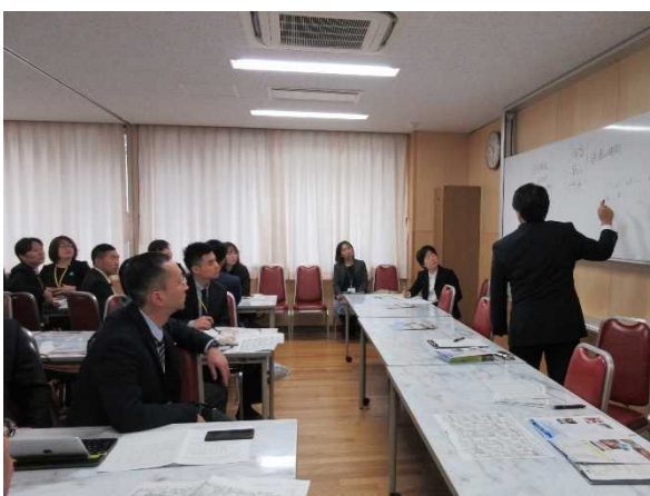
11月13日【访问交流】丰岛区立西池袋中学(第2分团)