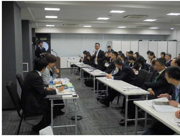
11月13日【听取讲座】文部科学省讲座