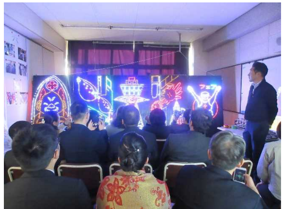
11月15日【访问交流】大阪府立今宫工科高中 (第2分团)