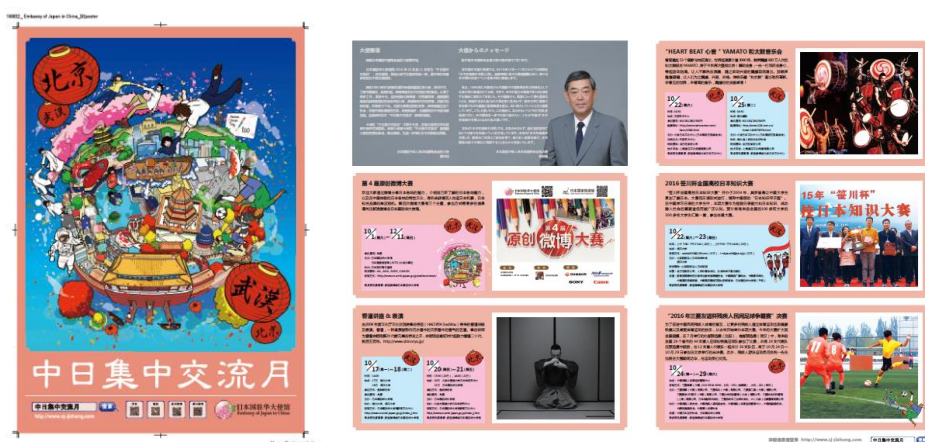
2016年「日中交流集中月間」広報資料